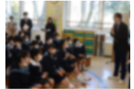
【これまでの学びを生かし、公開授業に挑む姿】

2月17日、令和5年度授業力アップ講座を開催し、県内外からたくさんの方々が来校しました。各授業では、日頃の学習の成果を発揮して、友達の考えを自分の考えに生かしたり、自分の問いを粘り強く解決したりしようとする姿が見られました。参加された先生方からは、「附属小の子どもたちの学習に意欲的に取り組む姿や学び合う姿を見て、自分の学級の子どもにも現れるように、今回学んだことを生かしていきたいと思いました。」「一人一人が自分の考えや意見に自信をもち、友達と伝え合う姿がすごいと思いました。」といった子どもたちの学びの姿に対する称賛の声が聞かれました。